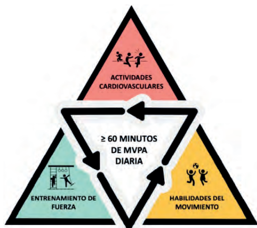
-Faigenbaum et al., 2020-